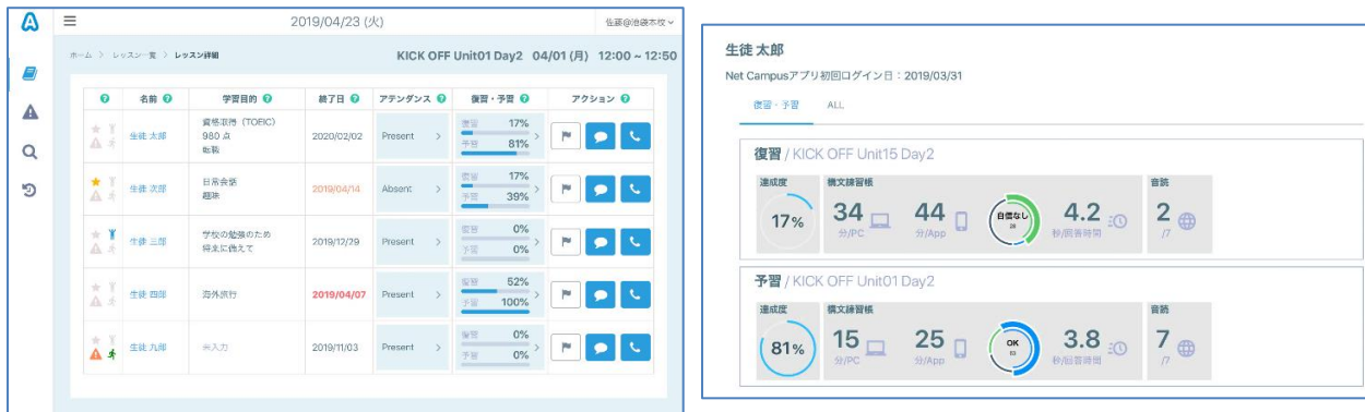
生徒の学習目的や進捗状況一覧

英会話教室を運営するイーオン、KDDI、および KDDI デジタルデザインは、教育と ICT を組み合わせた「EdTech」を推進する共同プロジェクト「イーオン デジタルトランスフォーメーション AEON DX」（以下「AEON DX」（注1））第2弾として、生徒の自宅学習状況やスクールでのレッスンの進捗などをデータベース化し、取得したデータの分析結果に基づきレッスンやカウンセリングを生徒個別に最適化する「AEON NOTE」を全国スクール（注2）に、2019年5月13日より導入します。